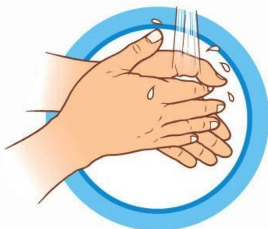
ЧАСТО МОЙТЕ РУКИ С МЫЛОМ